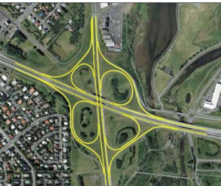
Mynd 1. Mislæg gatnamót Miklubrautar og Reykjanesbrautar.

Leiðarljós við hönnun vega eru eftirfarandi fjórir þættir: Umferðaröryggi, umhverfismál, afkastageta og fjárhagsleg hagkvæmni. Í pistli þessum er ætlunin að beina sjónum að fjárhagslegri hagkvæmni. Það er enginn vafi að eftir efnahagshrunið 2008 hafa kröfur almennings til lausna í vegamálum breyst mikið. Í stað krafna um 2+2 vegi (fjögurra akreina) sætta menn sig við 2+1 vegi (þriggja akreina með möguleikum á framúrakstri á víxl) sem koma fyllilega að sama gagni varð-