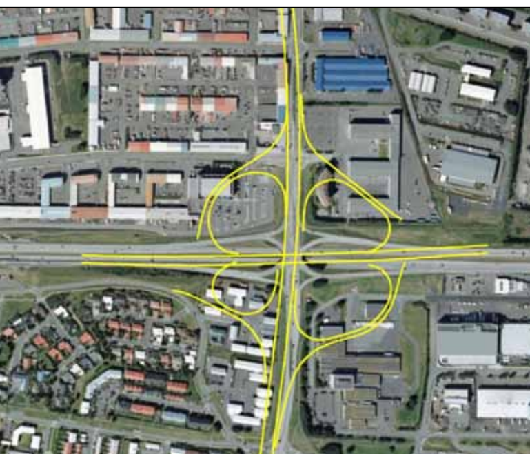
Mynd 2. Mislæg gatnamót Vesturlandsvegur og Höfðabakka. Til samanburðar eru teiknuð inn gatnamót, svokallaður fjögurra blaða smári.

andi öryggi og hafa nægjanleg afköst á þeim stöðum sem um ræðir. Kröfuharkan hefur vikið fyrir raunsæinu þegar við blasir fjárskorturinn. Augljóst er að næstu áratugin þarf að velja lausnir við hæfi og forðast að skjóta langt yfir markið í kröfum eins og gjarnan var gert fyrir hrun.