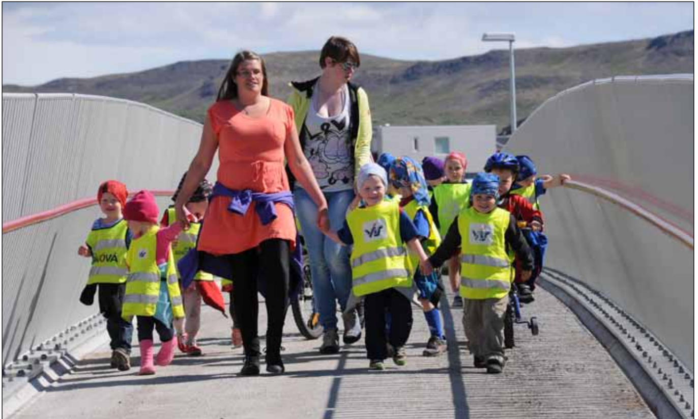
Börn úr Krikaskóla mættu í vígslu göngubrúar í Mosfellsbæ og sungu fyrir viðstadda.