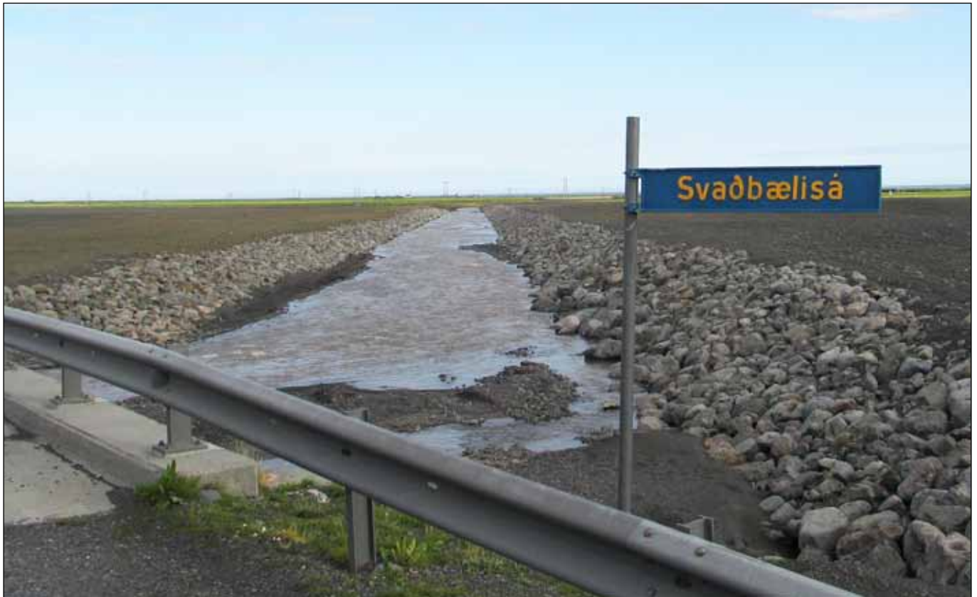
Nýr farvegur Svaðbælisár.